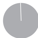
2. Taxonomiekonformität der Investitionen ohne Staatsanleihen*

■ Taxonomiekonform 0,00% ■ Andere Investitionen 100,00%