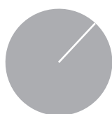
1. Taxonomiekonformität der Investitionen einschließlich Staatsanleihen*

■ Taxonomiekonform 0,00% ■ Andere Investitionen 100,00%